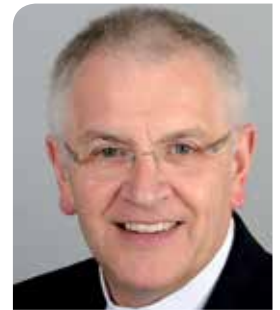
Heinrich Timmerevers Bischof von Dresden-Meißen